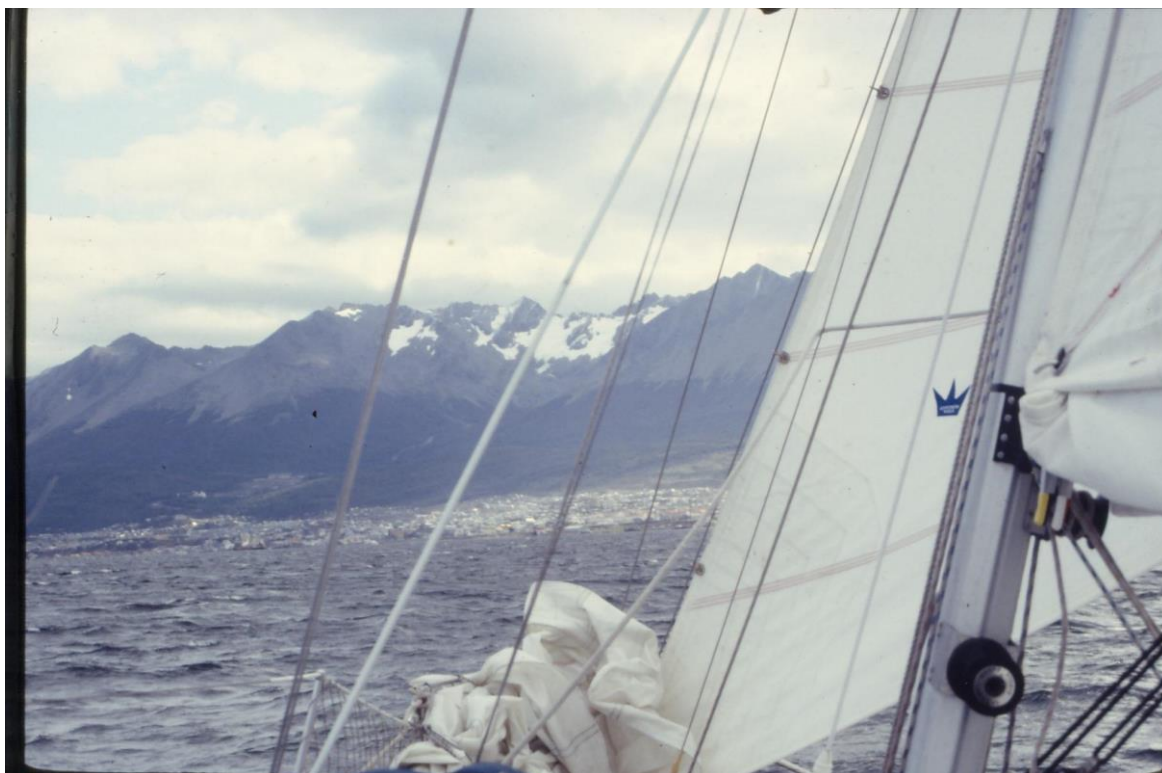
Αφιξη στην Ουσουάια

Παράλληλα, αναπτύχθηκε γοργά ο τουρισμός χάρη στη θεαματική φύση, με αποτέλεσμα ο κεντρικός δρόμος να θυμίζει περισσότερο ελβετικό θέρετρο χειμερινών σπορ, με ακριβά εστιατόρια και πολυτελείς μπουτίκ, παρά την πολίχνη σκαπανέων με τις τρώγλες από αυλακωτά πάμφυλλα όπως ήταν πριν από μερικά χρόνια. Τέτοια κτίσματα συναντιούνται σήμερα μόνο στην περιφέρεια κι εκεί μένουν φτωχοί Χιλιανοί μετανάστες.